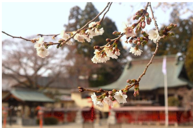
中田神社のシキザクラ (3月29日)

お伝えしていますように、安久町内会の令和8年度総会は4月19日(日)の開催です。当日は、総会に先立ち、午前9時30分から自転車を中心とした交通安全講座も実施します。総会は午前10時からで、総会の後は新たに班長に就いた方々を対象にした班長会議を開催し、班長の役割や担務内容について説明を行います。当日の日程は下記の通りです。会場は西中田コミュニティ・センター(西中田小学校東側)です。みなさまのご参加をお待ちしています。