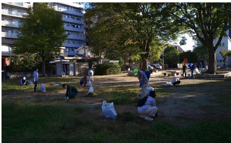
安久東公園の清掃活動

会の清掃活動のあと、生長の家のみなさんが地域奉仕活動として安久公園に入り、4台の草刈り機を持ち込んで繁茂していた雑草の刈り取り作業に当たりました。みなさん、ありがとうございました。