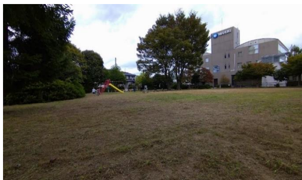
きれいに除草された安久公園

10月8日(日)午前7時から町内3つの公園で清掃活動が行われました。参加したみなさん、お疲れ様でした。なお、今回は町内